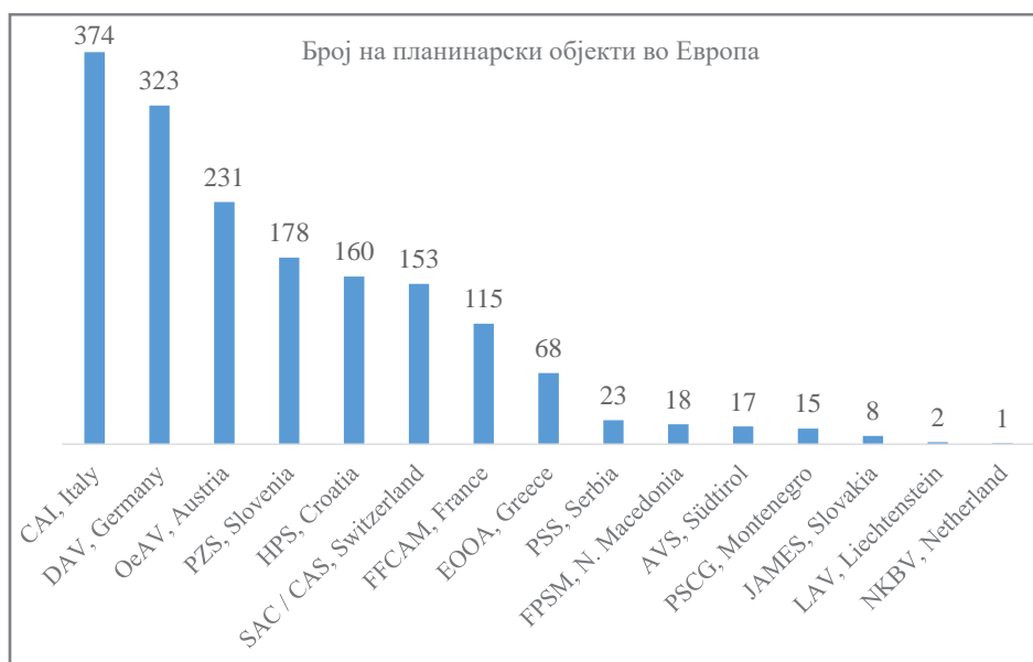
Графички приказ на бројот на планинарски објекти во 15 земји во Европа

Типови објекти: Во европските земји постојат различни категории и називи за планинарските објекти: (1) планински куќи или домови (Hut, Haus, Dom, Коќа, Casa) што нудат целосна услуга (сместување и исхрана) и се распоредени по должината на планинарските патеки со цел да им обезбедат поддршка на посетителите; (2) засолништа (Rifugio, Refuge, Bivouac, Bivacco, Biwak, Zavatisce, Shelter) лоцирани во близина на планинарските патеки, но не нудат услуги, ниту имаат персонал.