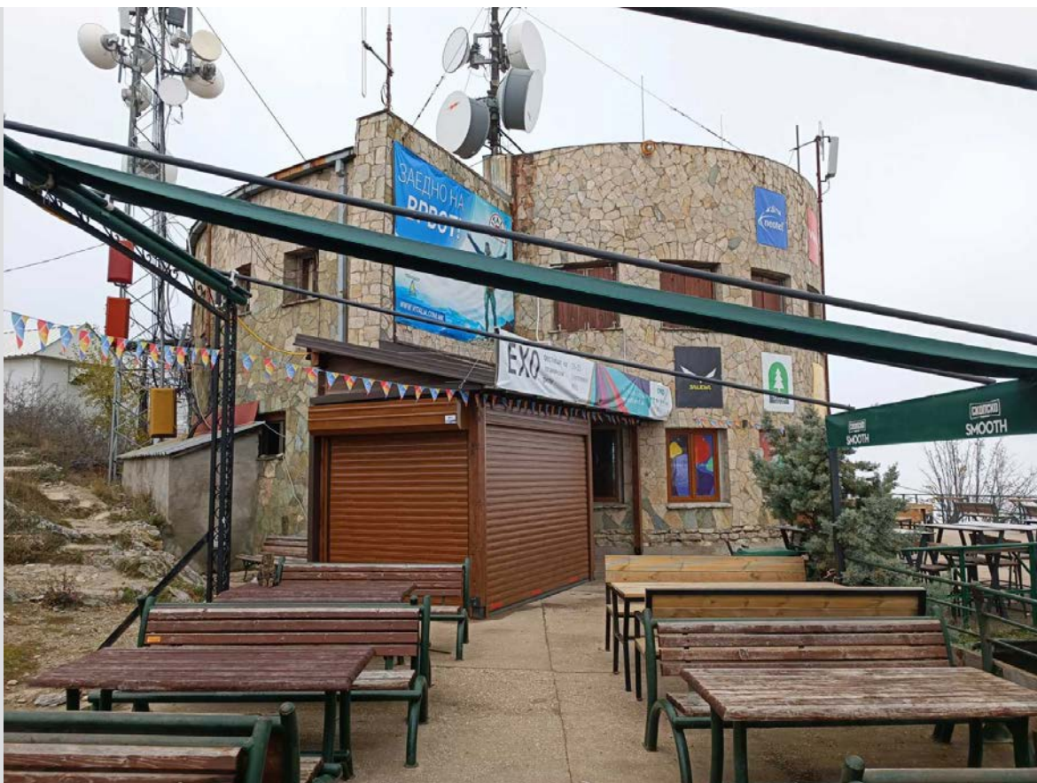
Планинарски дом „Даре Џамбаз“, Водно