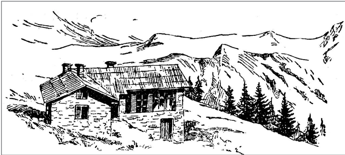
Планинарски дом „Јелак“, Шар Планина