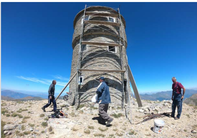
Кула на Титов Врв, Шар Планина