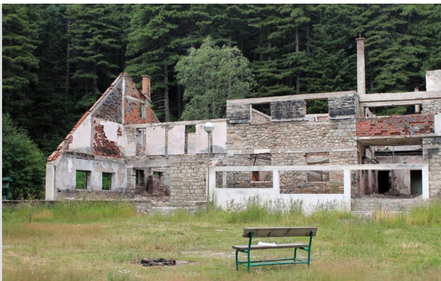
Планинарски дом „Копанки“, Баба Планина

Проблеми за решавање: Потребна е целосна изградба на домот.