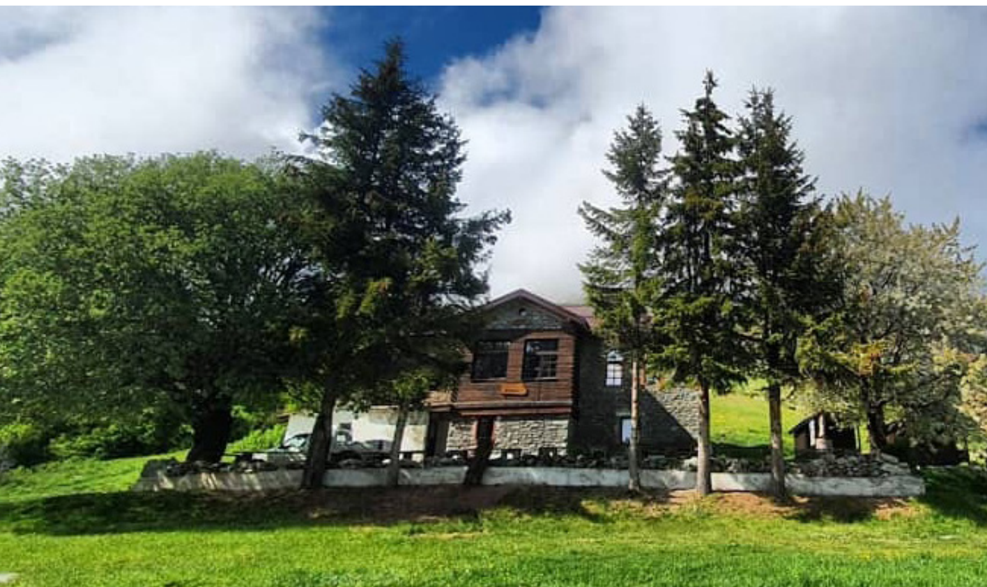
Планинарски дом „Љубошан“, Сџаро Село, Шар Планина

И покрај тоа што се предложени насоки и активности, неблагодарно е да не се земат предвид специфичностите на секој планинарски објект, кои зависат од неговата историја, сопственост, микро и макролокација, пристап, традиција, старост на објектот, вложувања и реновирања итн. Повеќе детали за планинарските објекти во Анексот I.