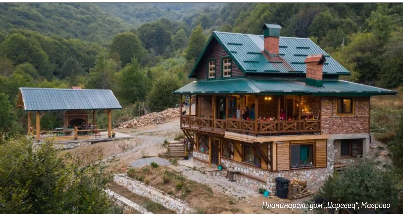
Планинарски дом „Царевиц“, Маврово