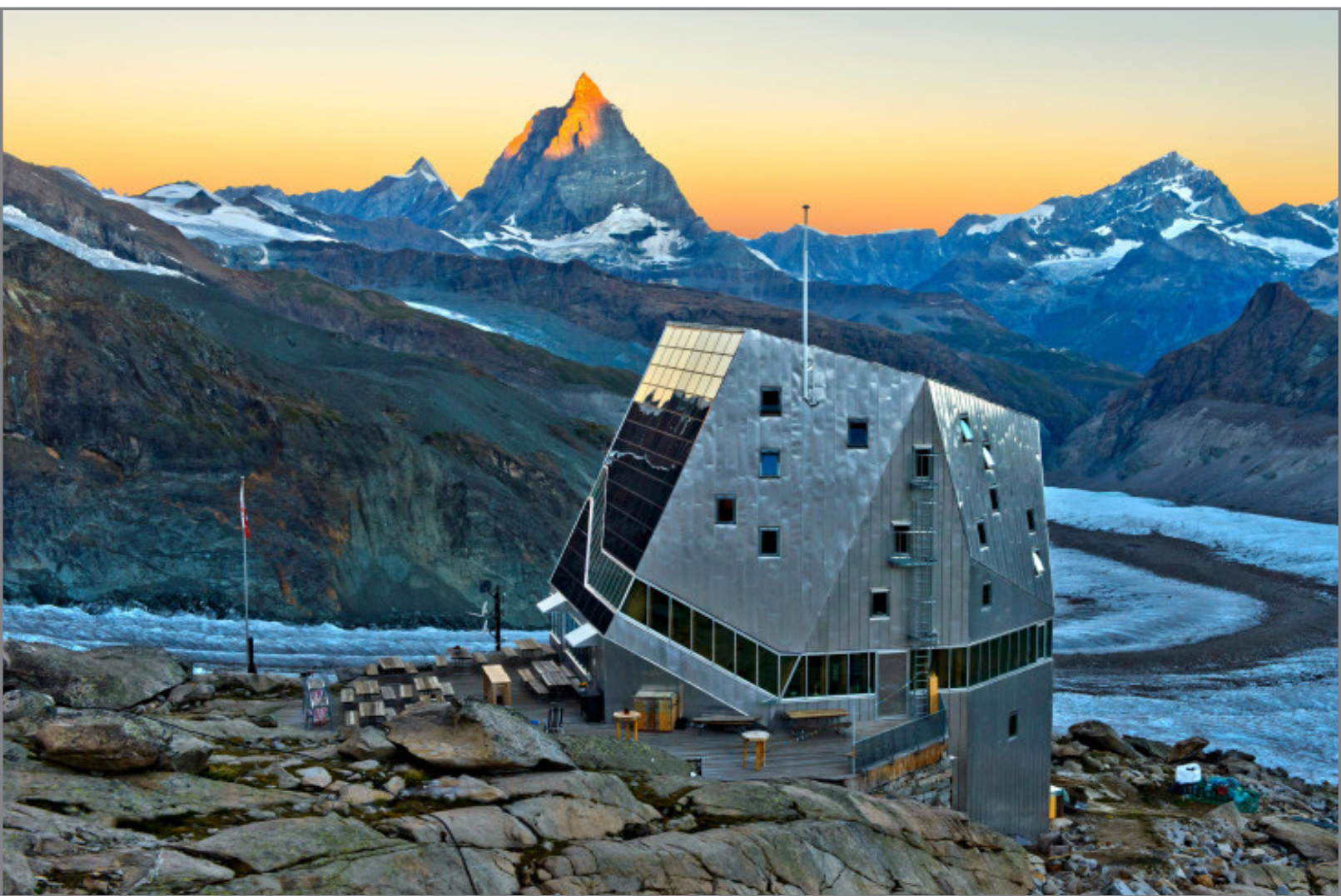
Планинарски дом „Монџе Роса“, Алпи, Швајцарија

Санитарни услови: 92% од анализираниите објекти во Европа имаат тоалети, а 8% немаат. Во 63% од планинарските домови во Република Северна Македонија има тоалети, а во 37% нема тоалети.