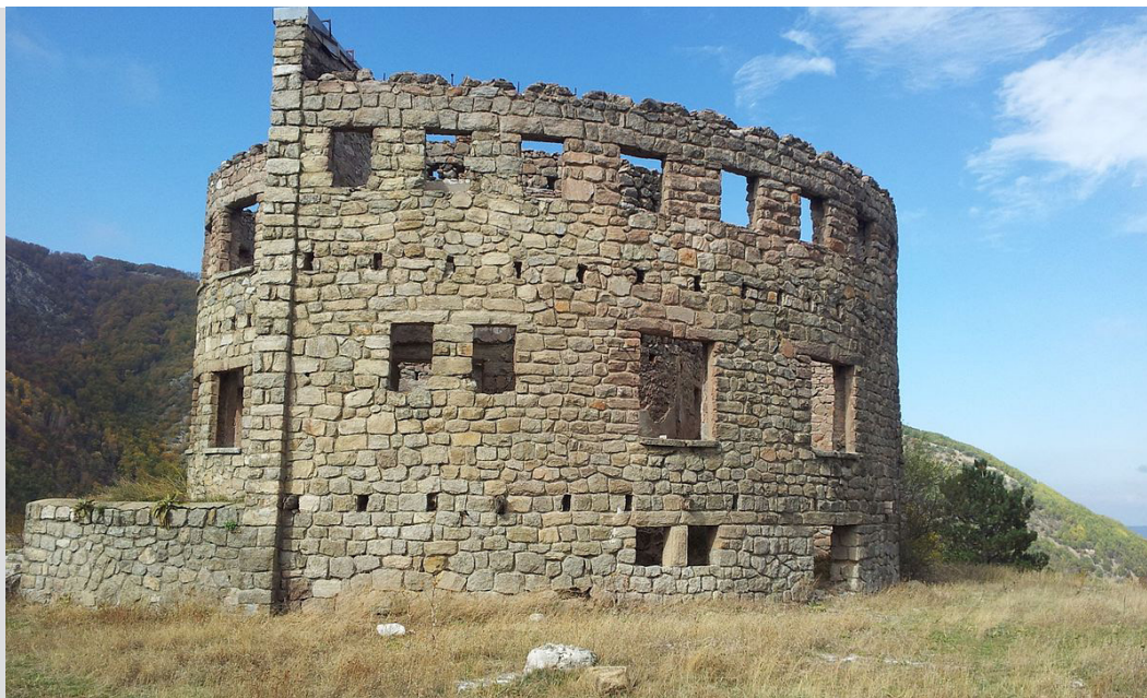
Планинарски дом „Дервен“, Селчка Планина

б: на Мал и Голем Мукос за 2-3 часа, до манастирот Степанци за 2-3 часа.