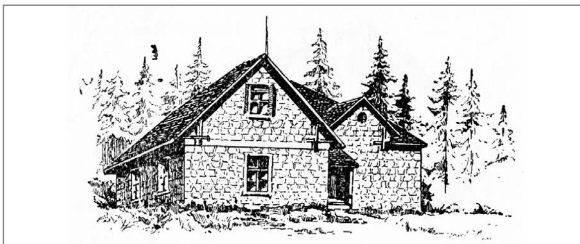
Планинарски дом „Коианки“, Баба Планина

За трите теми (патеки, планинарски домови и качувачки локалитети) беа идентификувани проблемите, како и предлог-решенија, а Карловиот универзитет направи анализа на регулативите и на институциите на ЕУ поврзани со планинарењето и качувањето карпи. Изработени се стратешки цели, база на податоци, интернет-страница, а ќе се одржуваат и обуки за претставници на сите асоцијации на ЕУМА за имплементација на стратегијата. Во периодот од мај 2021 до март 2022 членовите на работната група „Планинарски домови“ од нашата држава, Австрија, Словенија, Грција, Словачка и Германија направија истражување и анализа на собраните податоци за планинарски објекти од 15 европски држави, вклучувајќи податоци и од нашата држава. Тоа истражување и анализа ги поттикна членовите на работната група во проектот од ФПСМ да направат документ кој сеопфатно ја опишува состојбата на планинарските објекти во државата. Членовите на работната група во проектот од ФПСМ искрено се надеваат дека ФПСМ ќе продолжи со воспоставените одлични односи со ЕУМА и со дополнување и обновување на податоците презентирани во овој документ.