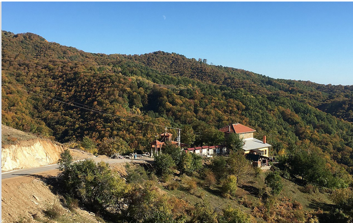
Планинарски дом „Вршешка“, Плачковица

на правата на недвижностите. Веднаш по донесувањето на оваа одлука Владата истата ја доставила до ФПСМ и побарала планинарскиот дом да биде испразнет од луѓе и ствари и предаден на МВР. На ова ФПСМ реагирала така што доставила Известување до Владата дека планинарскиот дом „Даре Џамбаз“ е изграден од ПСМ (денес правен наследник е ФПСМ) со сопствени средства и согласно Законот за сопственост и други стварни права, сопственост над одреден недвижен објект се стекнува, меѓу другите начини, и со градба на објект, како и тоа дека и покрај тоа што за време на земјотресот и поплавата во Скопје исчезнал поголем дел од документацијата за изградбата на овој планинарски дом, ФПСМ и денес располага со одредена изворна документација стара над 60 години, која неоспорно потврдува дека ПСМ го градел планинарскиот дом „Даре Џамбаз“. Поради тоа, ФПСМ побарала од Владата да изврши преоцена на предметната Одлука и да направи соодветна измена на Одлуката.